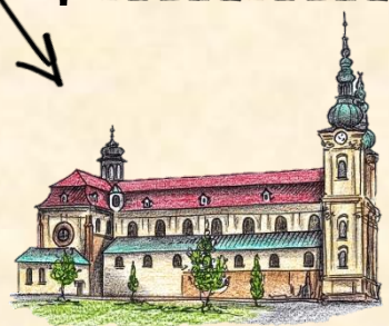
Nápověda: Cyril a Metoděj

Slovo „Laetare“ znamená „Raduj se“ a objevuje se v liturgických textech 4. neděle postní. Postní kázeň je přerušena krátkým uvolněním, které se projevuje např. změnou liturgické barvy z fialové na růžovou nebo zdobením oltáře květinami.